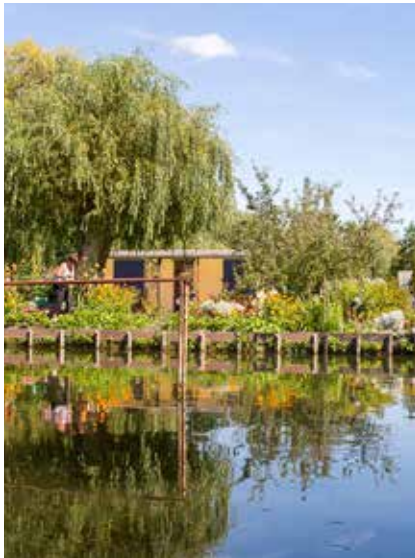
Les hortillonnages d'Amiens.

Sortie, après-midi dansant et dispositif de veille autour des plus fragiles : le Centre Communal d'Action Sociale (CCAS) déploie tous ses efforts en direction des Osnysois de plus de 65 ans.