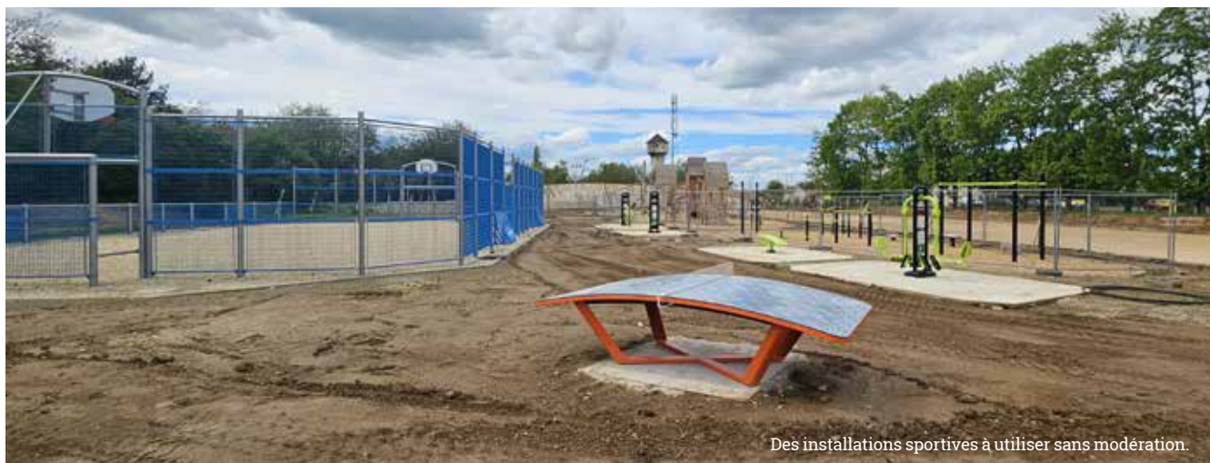
Des installations sportives à utiliser sans modération.