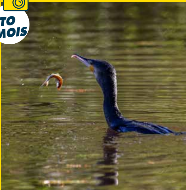
Par Gilbert Perreau, dans le Parc de Grouchy.