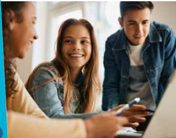
Le CCAS peut aider les étudiants à s'équiper pour leur scolarité.

Un rapide tour sur le site Internet de la ville vous éclairera sur la simplicité du formulaire à remplir et sur les critères d'obtention de cette bourse ! À savoir :