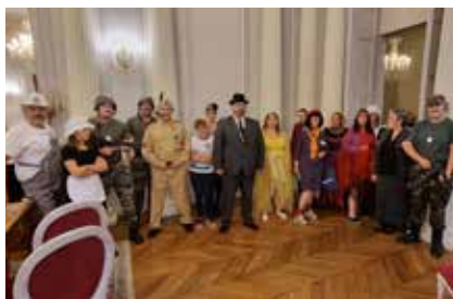
Les Mèmpokap lors des Journées Européennes du Patrimoine en 2021. Toujours l'occasion de rire tout en se cultivant !

Dans les combles du Château de Grouchy, le Musée Thornley vous attend pour sa 1 re Nuit des musées, samedi 13 mai. Découvrez l'artiste, qui a vécu plus de 40 ans à Osny, avec cette visite décalée et humoristique par la troupe des Mèmpokap.